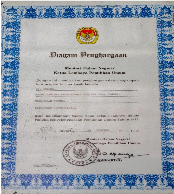
Piagam Bu Suyono