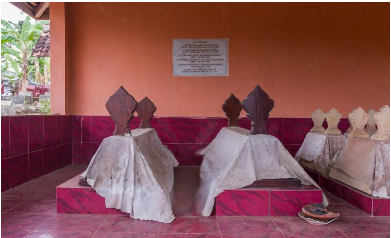
Makam Lurah Tirtadimeja