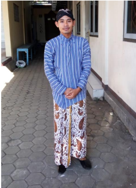
Foto 11. Carik/Plt. Kepala Desa Bunder