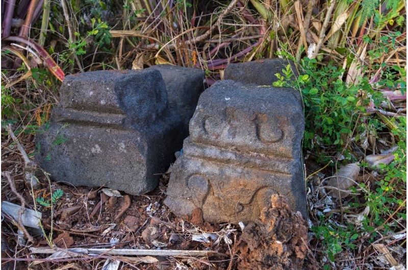
Ompak Kabupaten Semangkar