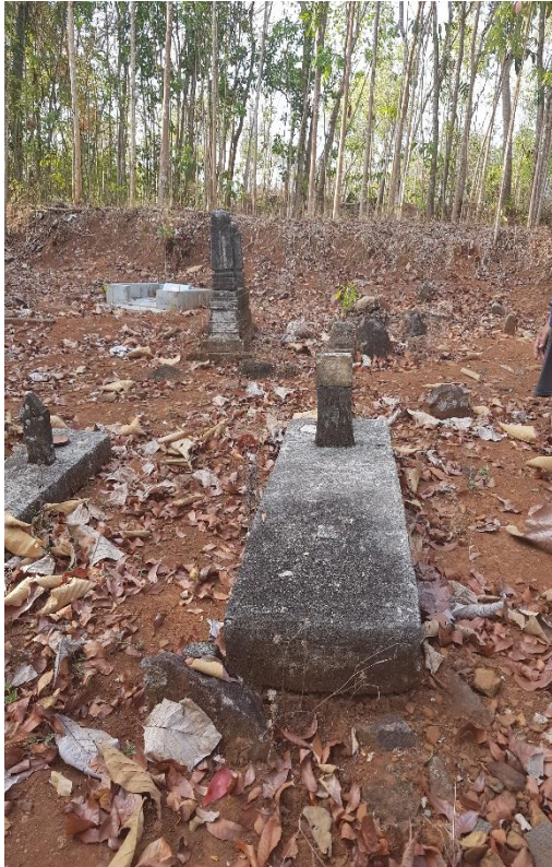
Makam sesepuh Mbah Jopak