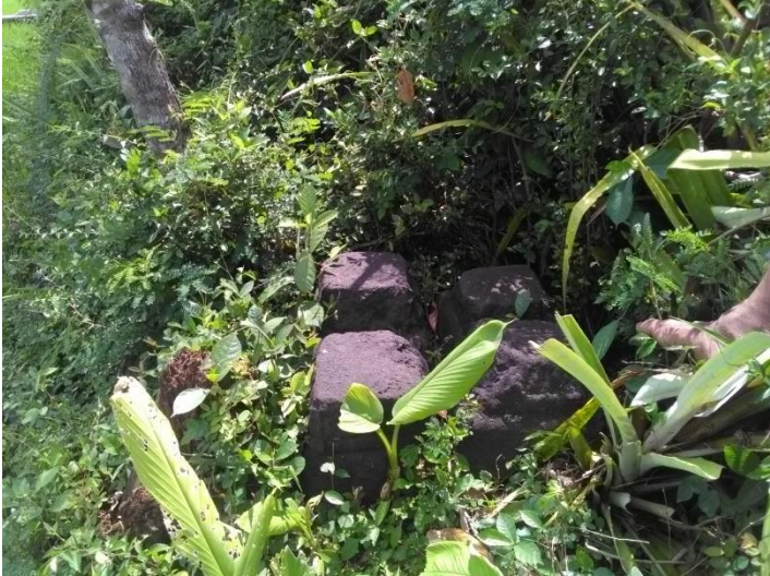
Petilasan Ompak Pendopo Kabupaten Semingkar